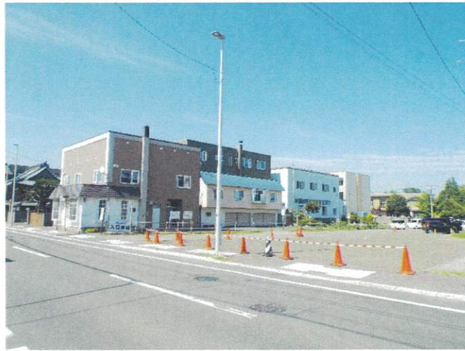
境内横の駐車場が拡張されました。写真に写る通用門横の茶色の建物はお盆までに取り越され境内と一体になります。